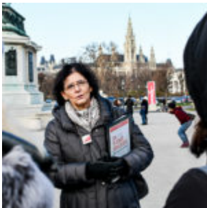
Unterwegs mit Fremdenführerin der „Austria Guides“