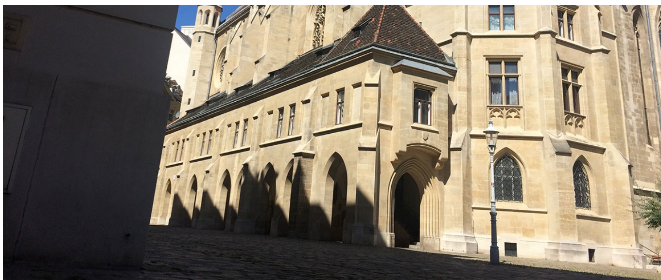
Die Minoritenkirche auf dem Minoritenplatz

Das ist schwer, weil es viele schöne Plätze in Wien gibt. Besonders mag ich den Minoritenplatz mit der Minoritenkirche, aber auch am alten Universitätsplatz, dem Ignaz-Seipl-Platz, bin ich gerne. Auch in Grinzing gibt es viele tolle Plätze mit dieser ländlichen Atmosphäre.