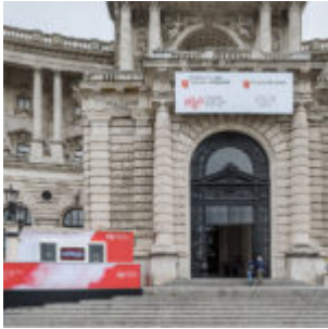
Neue Burg am Heldenplatz mit Eingang zum Haus der Geschichte