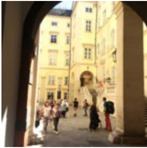
Führung im alten Trakt der Hofburg

gut heißt. Das kann dazu führen, dass er die Gruppe verlassen muss. Es bleibt letztendlich jedem Kollegen selbst überlassen, ob er Führungen zu diesem Thema machen möchte.