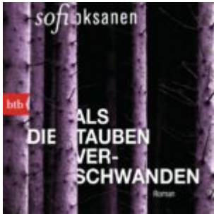
Als die Tauben verschwanden von Sofi Oksanen