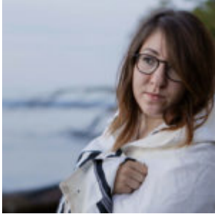
Deborah Feldman