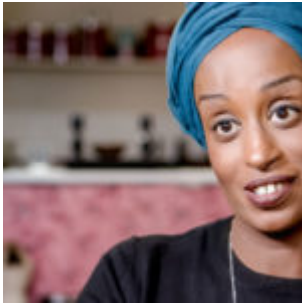
Leyla Hussein