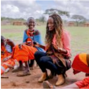
Leyla Hussein zu Gast bei den Masai