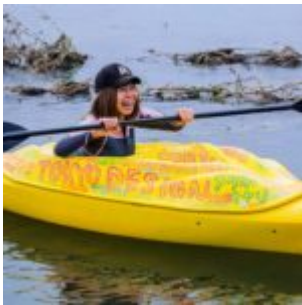
Die japanische Künstlerin Rokudenaschiko in ihrem Vagina-Boot