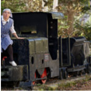
Unterwegs mit Frau Franzi in Grünbach