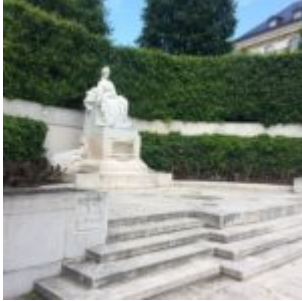
Kaiserin Elisabeth Denkmal