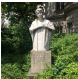
Schauspielerin Hansi Niese

Beginnen wir sie bewusst wahrzunehmen, sticht aber vor allem eines ins Auge. Es gibt kaum Denkmäler von Frauen. Mit rund sieben Prozent sind Darstellungen von weiblichen Personen im öffentlichen Raum als eine Minderheit zu betrachten. Zudem dienen sie in den meisten Fällen lediglich als Beiwerk in den großen, den Männern gewidmeten Denkmälern oder sind in Form einer Allegorie anzutreffen. Statuen und Büsten, die historische Frauenpersonen ehren, sind auch heute noch beinahe an einer Hand abzählbar. Frauendenkmäler bildeten und bilden im Stadtbild immer noch eine Seltenheit.