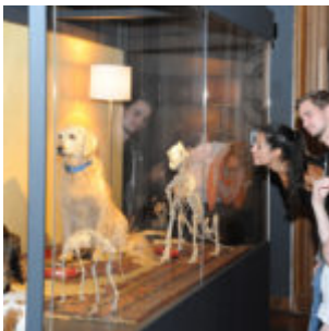
Ausstellungsansicht „Hund & Katz“