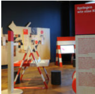
Ausstellungsansicht „Hund & Katz“