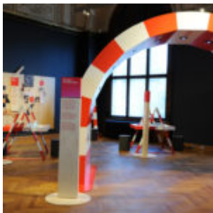
Ausstellungsansicht „Hund & Katz“

Für die Kunstliebhaber unter den Museumsgängern befindet sich eine kleine aber feine Auswahl an Gemälden an der Wand. Diese hätte jedoch durchaus umfangreicher ausfallen können – eroberte doch gerade die Katze im 19. Jahrhundert die Leinwände.