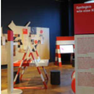
Ausstellungsansicht „Hund & Katz“