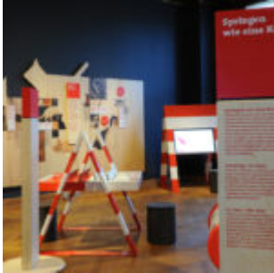
Ausstellungsansicht „Hund & Katz“