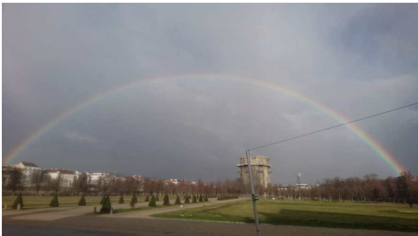
Flakturm im Augarten an einem Wintermorgen im März