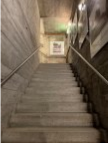
Zum Erinnerungsra- um