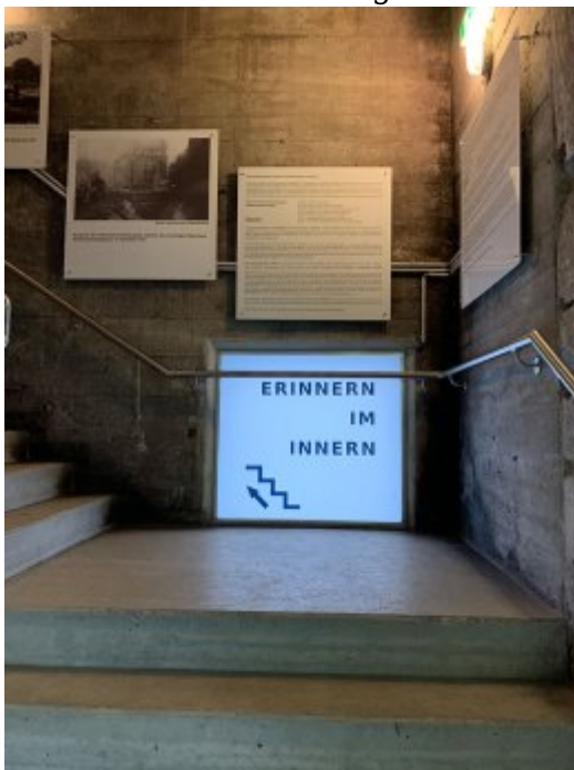
Aufgang zum Museum „Erinnern im Inneren“

Inwieweit ging es bei der Errichtung auch darum Sicherheit zu suggerieren? Auf der anderen Seite ist so ein Bau doch ein Eingeständnis, dass es nicht gut läuft im