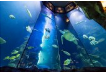
Aquarium im Haus des Meeres