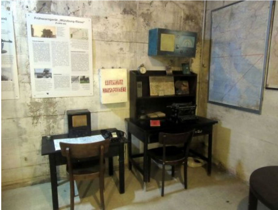
Ansicht des Ausstellungsraums