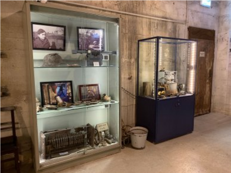
Ausstellungsansicht mit Vitrine für Sonderausstellungen