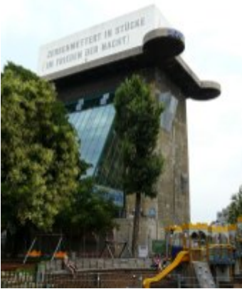
Außenansicht Haus des Meeres vor dem Umbau mit Schriftzug von Laurence Weiner