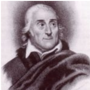
Lorenzo da Ponte