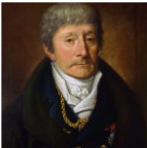
Antonio Salieri von Joseph Willibrod Mahler

In Wien verstorben ist Antonio Vivaldi. Eine Gedenktafel an der TU (Technische Universität) erinnert an den 1741 auf dem Gelände (damals befand sich hier ein Friedhof ) begrabenen Komponisten. Seit 2001 hält zudem ein Vivaldi-Denkmal aus Carrara-Marmor hinter der