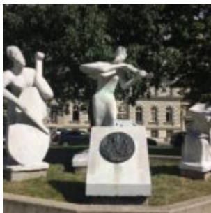
Vivaldi Denkmal hinter der Votivkirche

Ein weiterer Italiener zu dieser Zeit in Wien war Lorenzo da Ponte. Der Librettist wurde 1781 von Josef II. zum Theaterdichter ernannt (u.a. weil der Kaiser die italienische Opern anstelle des deutschen Singspiels fördern wollte). Ponte schrieb in Wien Libretti für Salieri und Mozart. Zudem liefern seine Memoiren Aufschluss über das musikalische Leben der Stadt. Heute halten das „da Ponte Research Center“ in der Goethegasse und das Mozarthaus die Erinnerung an den 1838 in Amerika verstorbenen Künstler wach.