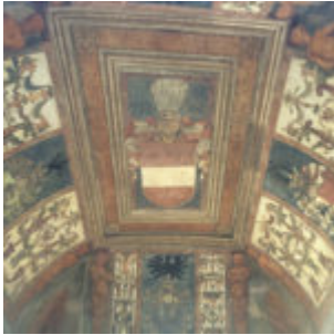
Schweizertor: Blick an die Decke