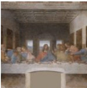
Kopie des letzten Abendmahls

Italienische Kino-Illusionen erwarten die Zuschauer hingegen regelmäßig jedes Jahr im Frühjahr beim italienischen Filmfestival im Votivkino. Gezeigt werden vor allem aktuelle Arbeiten. Immer wieder stehen aber auch ältere Filme, die in den Kontext passen auf dem Programm.