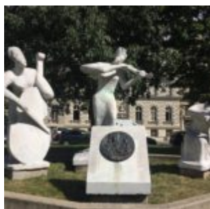
Vivaldi Denkmal hinter der Votivkirche

Ein weiterer Italiener zu dieser Zeit in Wien war Lorenzo da Ponte. Der Librettist wurde 1781 von Josef II. zum Theaterdichter ernannt (u.a weil der Kaiser die italienische Opern anstelle des deutschen Singspiels fördern wollte). Ponte schrieb in Wien Libretti für Salieri und Mozart. Zudem liefern seine Memoiren Aufschluss über das musikalische Leben der Stadt. Heute halten das „da Ponte Research Center“ in der Goethegasse und das Mozarthaus die Erinnerung an den 1838 in Amerika verstorbenen Künstler wach.