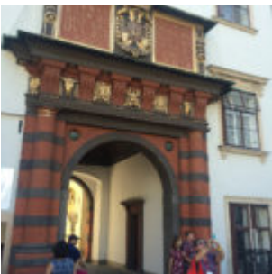
Das Schweizertor von Pietro Ferrabosco