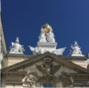
Antonio Canova Skulptur am Dach der Feuerwehr