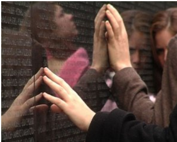
„Übertragung“ © Harun Farocki