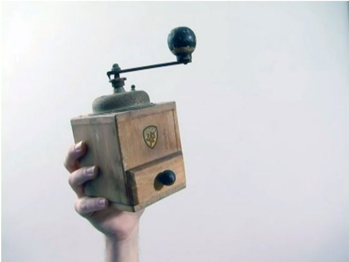
Videostill: „I Think This ist he Closest to How the Footage Looked“