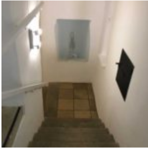
Stiegenaufgang im historischen „Kipferlhaus“