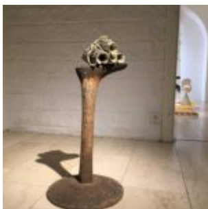
Skulptur von K.U.SCH. Renate Krätschmer