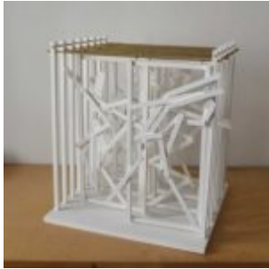
K.U.SCH. Rhythmische Gestikulationen