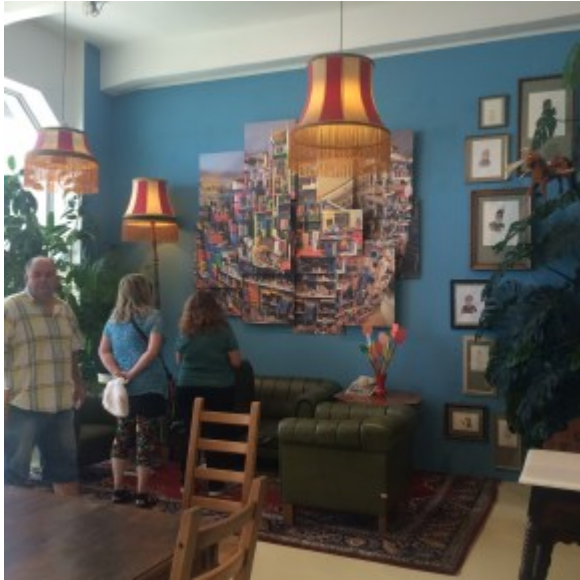
Kunst und Kaffee im Aufenthaltsraum