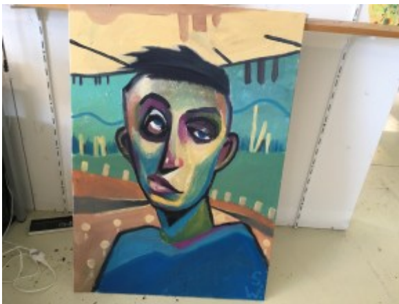
Bald an der Wand zu bestaunen