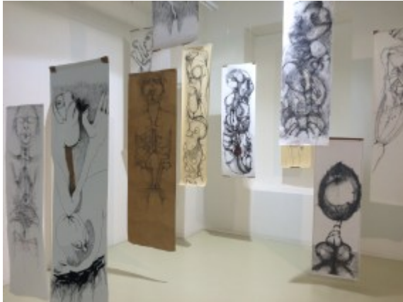
Die Kunst des Zeichnens ganz nah