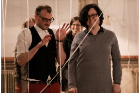
Vorstellung in der Galerie „die Schöne“