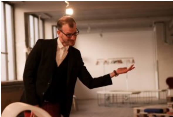
Schauspieler und Illusionist Philipp Oberlohr

Alles was man dafür braucht, ist - nebst eines Tickets - Vertrauen. In diesem Punkt unterscheidet sich der Besuch der irgendwo zwischen Improtheater und unkonventioneller Zaubershow angesiedelten Vorstellung wenig von einem herkömmlichen Theaterbesuch. Allerdings kann es einem im Rahmen von „das Spiel“ durchaus passieren, dass man sich plötzlich auf der Bühne wiederfindet und zum vermeidlichen „Mittäter“ wird. Was wäre eine Show, die auf die Mittel der Illusion setzt, ohne das Gefühl mit leichtem Magenkribbeln eine Reise in das Unbekannte anzutreten?