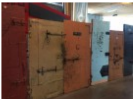
Türen diverser Zellen und Verhörräume