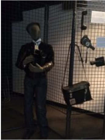
Unterwegs mit der Kamera