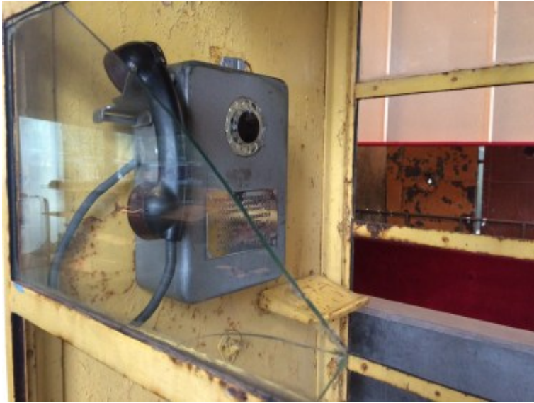
Estland Calling - viele Länder hörten den Schreien der Esten nach Unabhängigkeit nicht zu