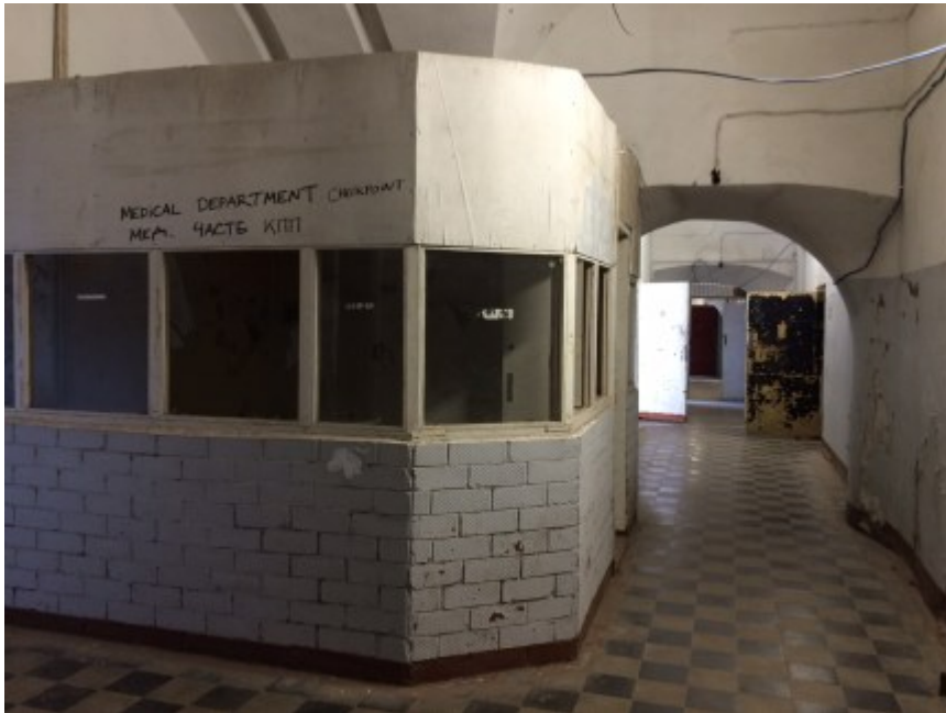
Platz für die Gefängnisaufsicht