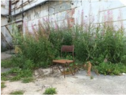
Im Hof des Patarei- Gefängnisses