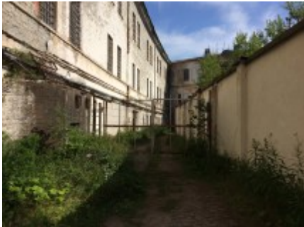
Eine Stunde in der Woche durften die Häftlinge im Freien verbringen