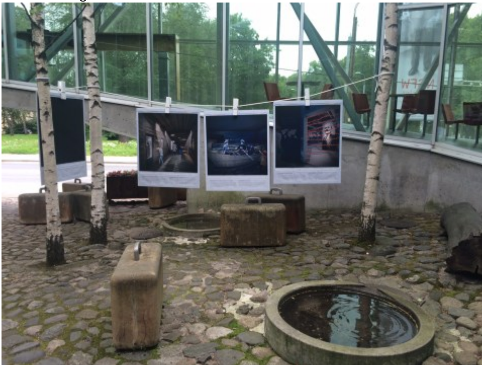
Eingangsbereich des Okkupationsmuseums