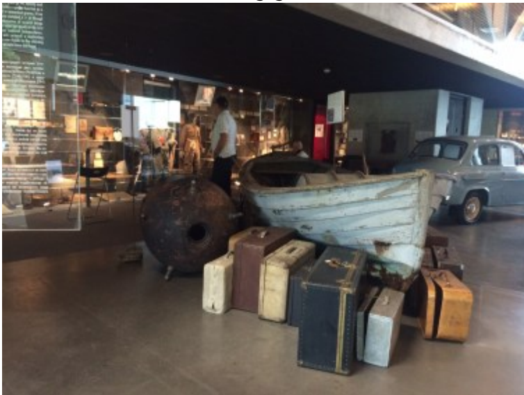
Zahlreiche Koffer erinnern an die Vertriebenen