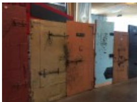
Türen diverser Zellen und Verhörräume