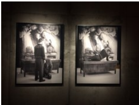
Sonderausstellung „A Chairman’s Tale“

Etwas, das viele bereits vorhergesehen hatten: Als die ersten russischen Panzer unter dem Vorwand Estland und andere Gebiete vor den Deutschen, die soeben Polen überfallen hatten, „zu beschützen“, einrollten blickte der junge estnische Staat seinem Ende entgegen. Bald begann die Sowjetmacht mit der Deportation Andersdenkender. Alleine am 21. Juni 1941 wurden über 9.000 Menschen aus ihren Häusern geholt und nach Sibirien verfrachtet. Unter den Eindrücken der Repression setzen viele Esten ihre Hoffnung zunächst auf die Deutsche Wehrmacht. Hitler brach das Abkommen mit der Sowjetunion und deutsche Truppen überschritten am 7. Juli die Grenze Estlands, wodurch die Stadt und das Land von einer Willkürherrschaft in die nächste gerieten. Die von den Esten innig erhoffte Wiederherstellung der Unabhängigkeit erfolgte nicht. Der deutsche Diktator verfolgte vielmehr das Ziel, Estland dem Deutschen Reich anzugliedern. Die erhofften „Befreier“ entpuppten sich ebenfalls als pure Aggressoren.